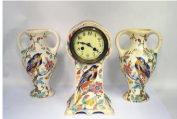
PZH, kaststel, NP Blauwvogel, Japonaiserie, 1914; coll. Meentwijkstra