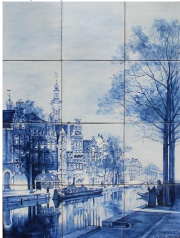
Distel, tegeltableau, naar J. Klinkenberg, Gezicht op Zuiderkerk, ca 1910; coll. Meentwijkstra