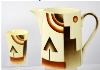
Soc. Céramique, Art Déco, ca 1930; coll. Fam. Branolte