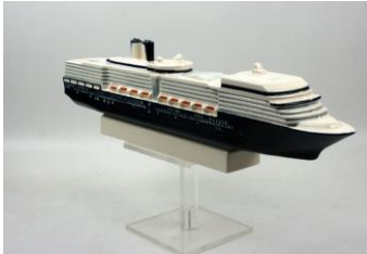
Goedewaagen, miniatuur MS Nieuw Amsterdam, 2015, l. 42 cm, ontwerp Sander Alblas