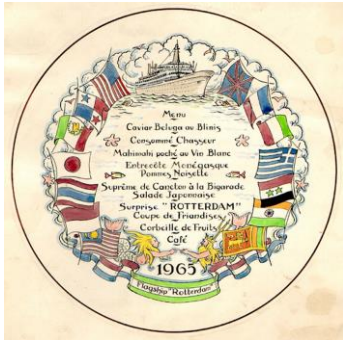
Goedewaagen, ontwerp wandbord worldcruise Rotterdam V, aquarel Piet de Jong