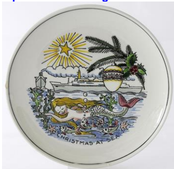
Goedewaagen, Kerst-editie; ontwerp Piet de Jong, ca 1963