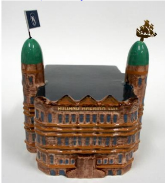
Goedewaagen, miniatuur Hotel New York, 2010, ontwerp Sander Alblas