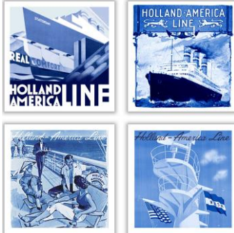
Goedewaagen Mariner-tegels, 10 x 10 cm, ontwerp Sander Alblas