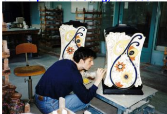
Goedewaagen, unica beschilderd door Sander Alblas voor MS Veendam, 1999