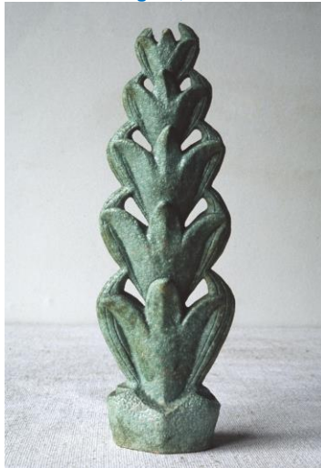
Bert Nienhuis, floraal object, h. 32,5 cm, jaren 30