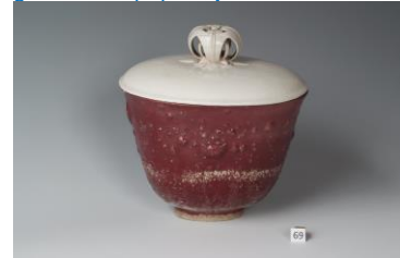
Bert Nienhuis, dekselpot, 1949, os- senbloedrood met glanswit deksel