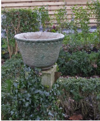
Bert Nienhuis, cachepot, 1938