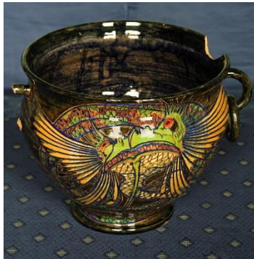
Bert Nienhuis, cachepot, motief waterdraak, 8 mei 1899, Lotus-signatuur