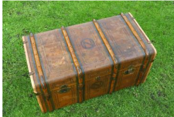
Hutkoffer van Bert Nienhuis met 80 stuks ateliercollectie en fotodossier