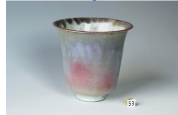
Bert Nienhuis, vaas, matterend paars naar koperrood, 1954