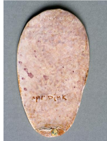
Bert Nienhuis, keramisch blad met glazuurrecept pink, jaren 40