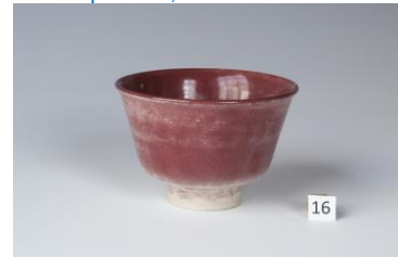
Bert Nienhuis, porseleinen teabowl met ossenbloedrood glazuur, ca 1951