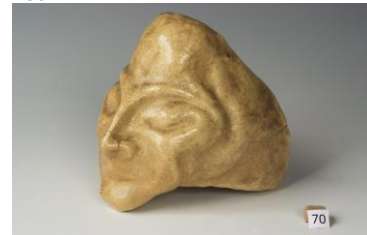
Séline d'Andrade, maskerplastiek, 1921, Quellinus