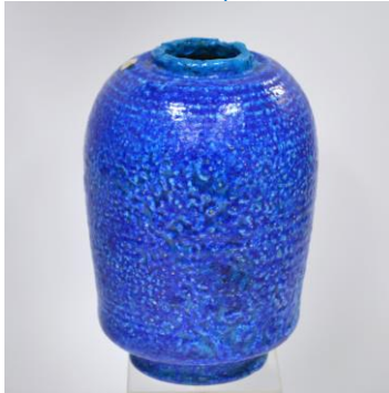
Bert Nienhuis, expressief gedeco- reerde vaas in blauw, 1938