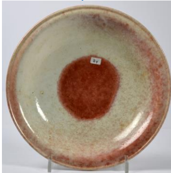
Bert Nienhuis, schaal met ossen- bloed koperexperiment, 1950