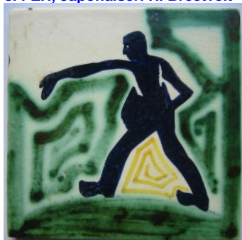
9. ESKAF, tegel, Zaaier, H. Krop

1,4,5,9 coll. B.J Baas; 2,3,6,8 coll. J.H. Branolte; 7 coll. Meentwijk