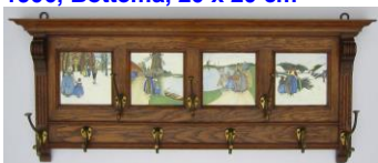
5. Potterij Rembrandt, Utrecht, eikenhouten kapstop met 4 streekdrachttegels