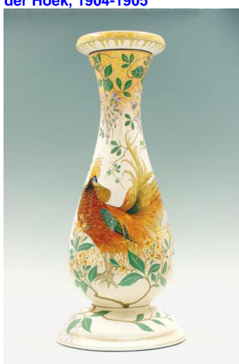
7. PZH, Piedestal, decor goudfazant, W. Hartgring, ca 1909