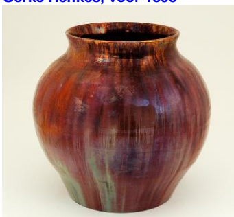
2. Porceleyne Fles, Berbas, lustervaas, ca 1895