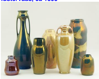
3. St. Lukas-Utrecht, lusterglazuren G. Offermans, 1909-14